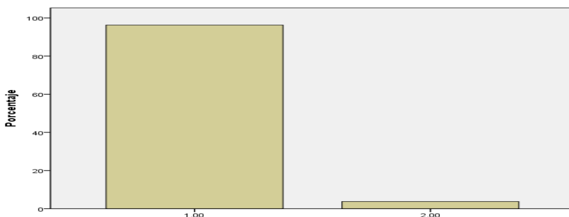
Gráfico 3. Dimensión 3: Nivel crítico intertextual